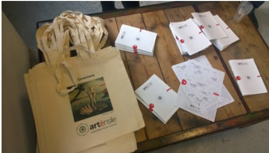
Artensile 2016 premiazione