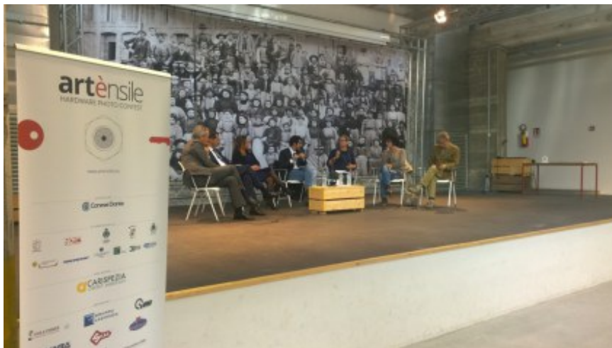
Artensile 2016 premiazione