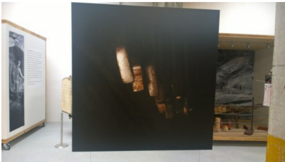
Artensile2016 Davide Gallo