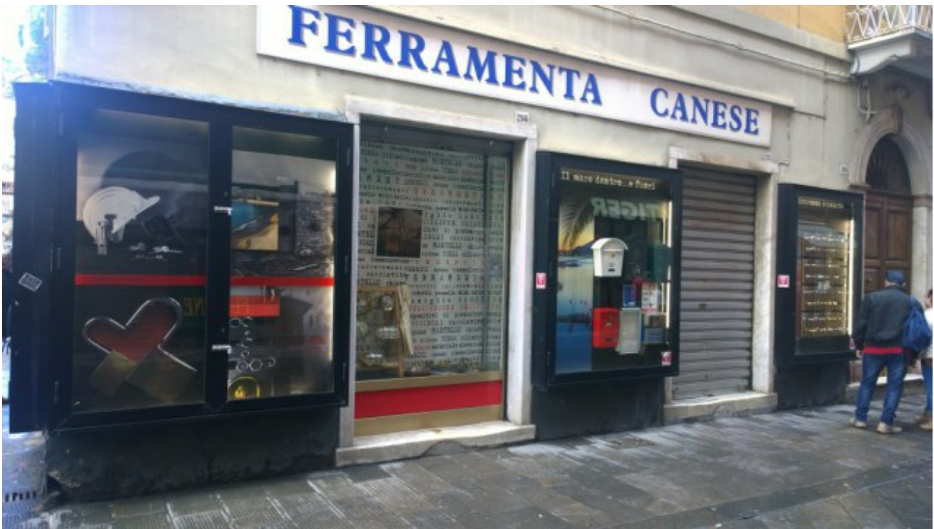
Artensile 2016 in centro città