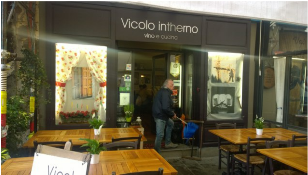
Artensile 2016 in centro città