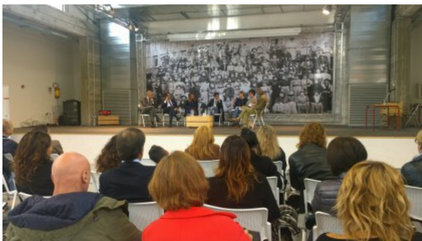
Artensile 2016 premiazione